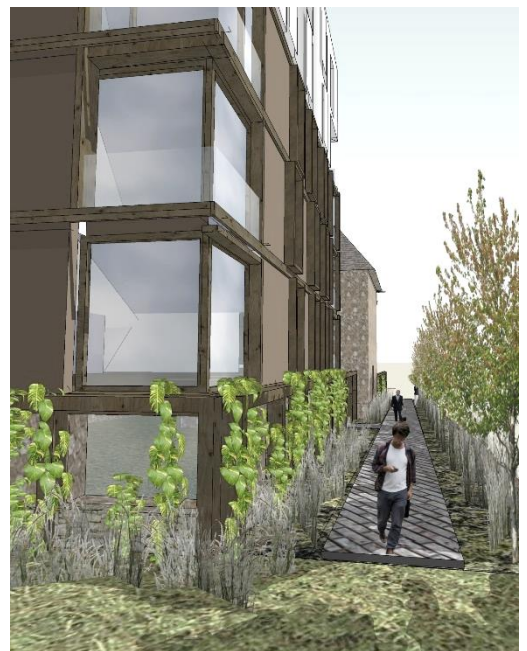
Vue depuis la venelle créée