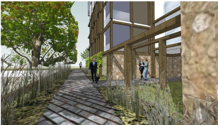
Venelle vers le jardin de l'abbaye