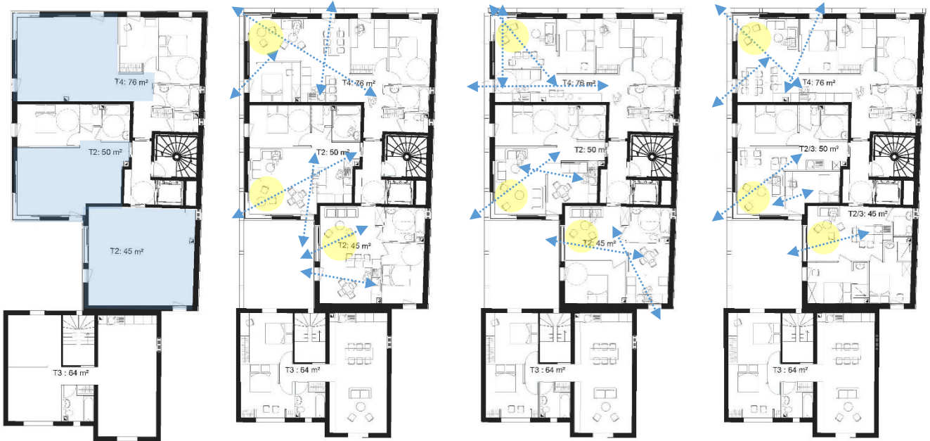
« Petite pièce en plus »