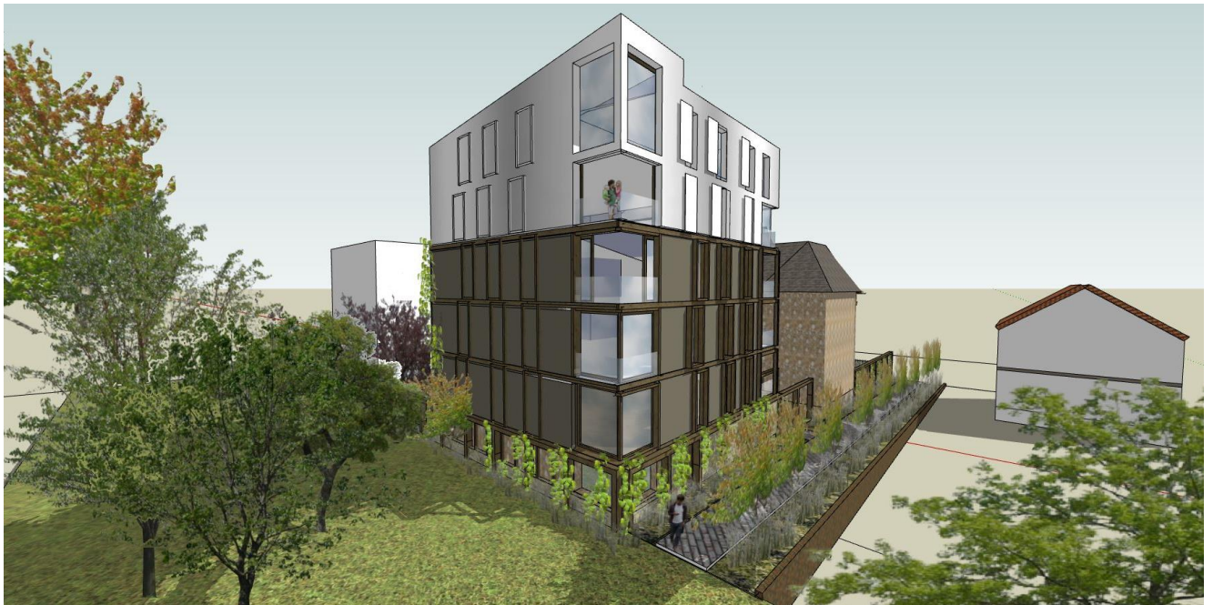
Vue depuis le jardin de l'abbaye