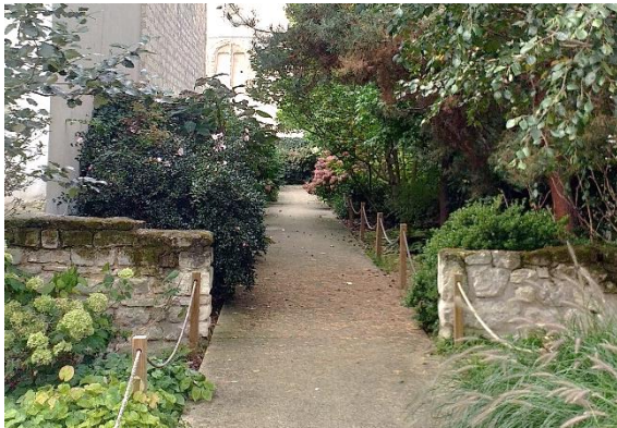
Jardin de l'abbaye